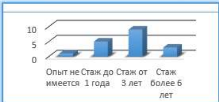
Соотношение требований к опыту работы у соискателя на должность технолога общественного питания.