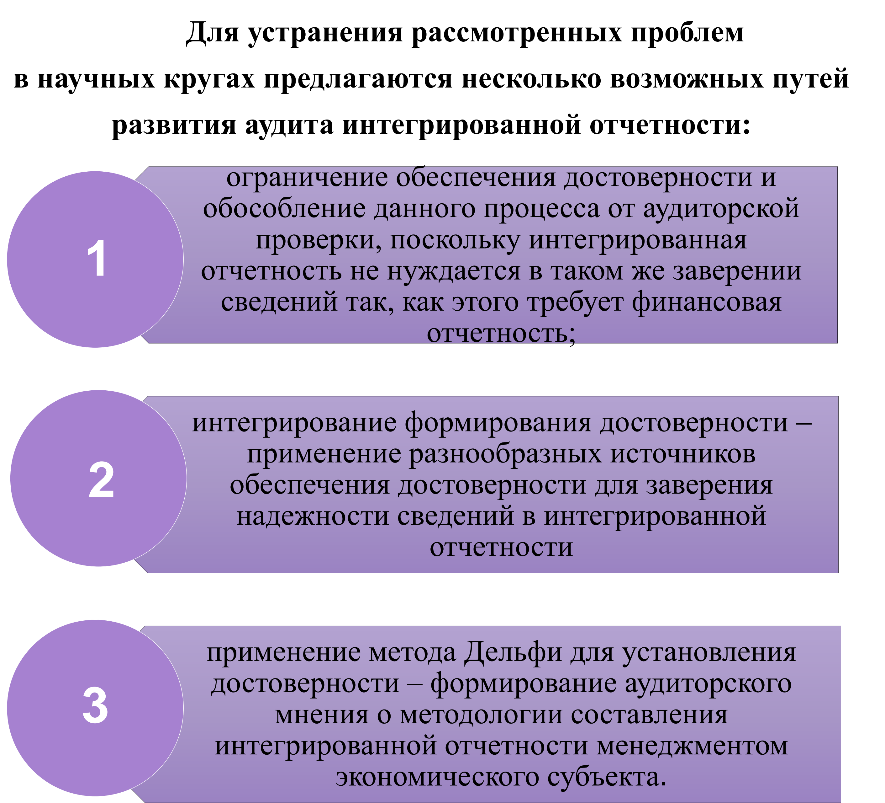
Рисунок 2 – Особенности интегрированной отчетности и связанные с ними проблемы аудита достоверности