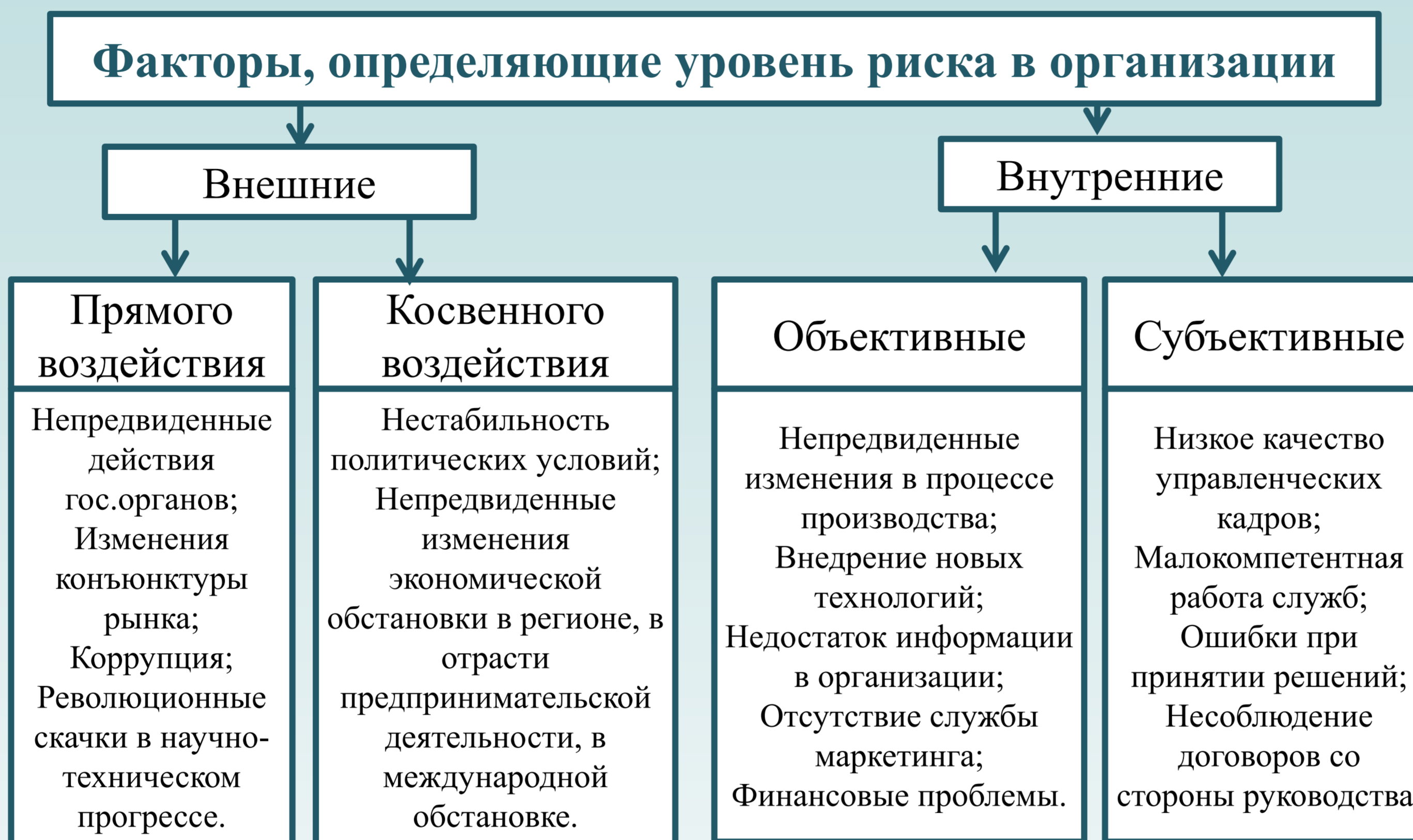
Рис. 1. Факторы, влияющие на уровень риска в организации

В период пандемии цифровая трансформация стала востребованным инструментом для создания и поддержания успешного функционирования организации. Устоявшиеся модели ведения предпринимательской деятельности не отвечают требованиям цифровой экономики, где ключевую роль играют клиентские сети, цифровые платформы, новые каналы коммуникаций, а также радикально модифицирующиеся технологии управления.