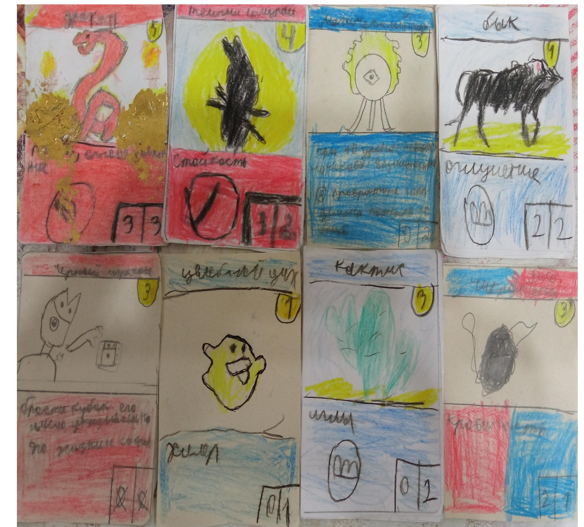
Примеры карт ККИ «Магия» (макеты)