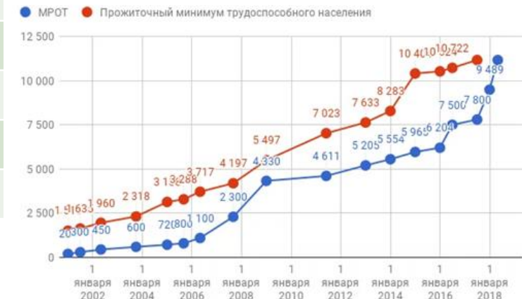
Динамика минимального размера оплаты труда (МРОТ) и прожиточного уровня в 2002–2018 гг.

Доходы, которые человек получает бесплатно, используя различные учреждения социальной инфраструктуры.