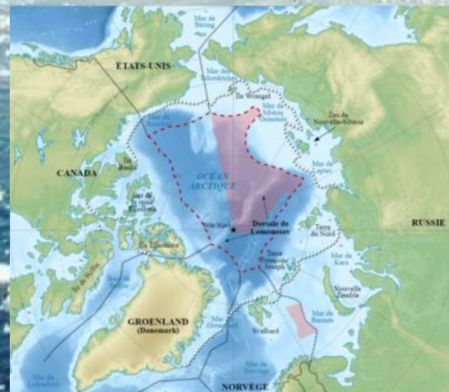
Современная карта Арктики

Вывод: В ходе изучения «Развития Арктики» мною выявлены перспективы данного направления. Арктика обладает большим наследием железной руды, фосфатов, никеля, меди, алмазов и драгоценных металлов.