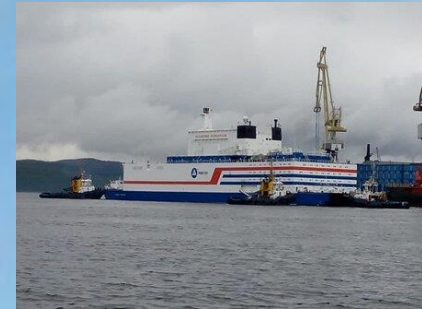
ПАТЭС «Академик Ломоносов»