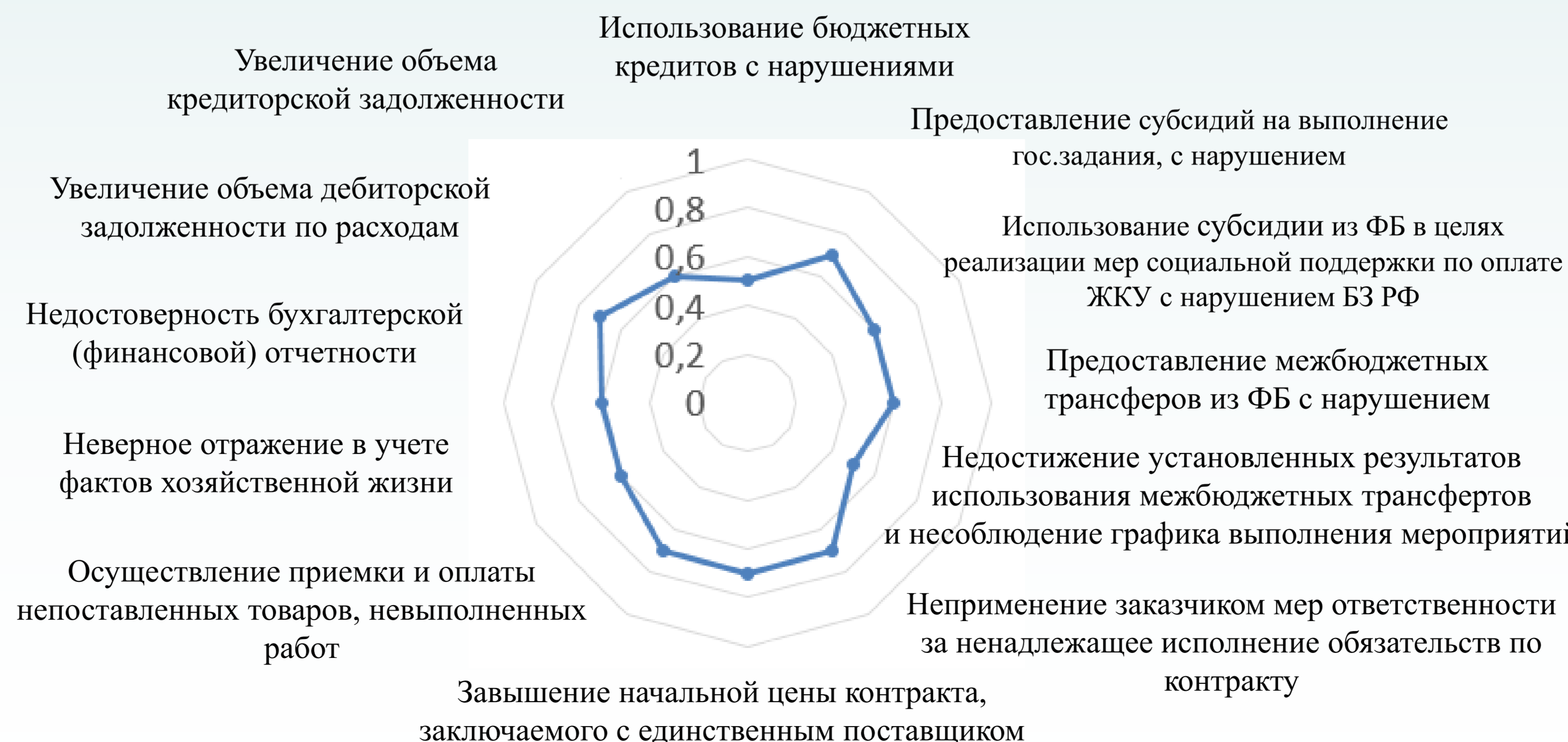
Рис. 2. Карта бюджетных рисков