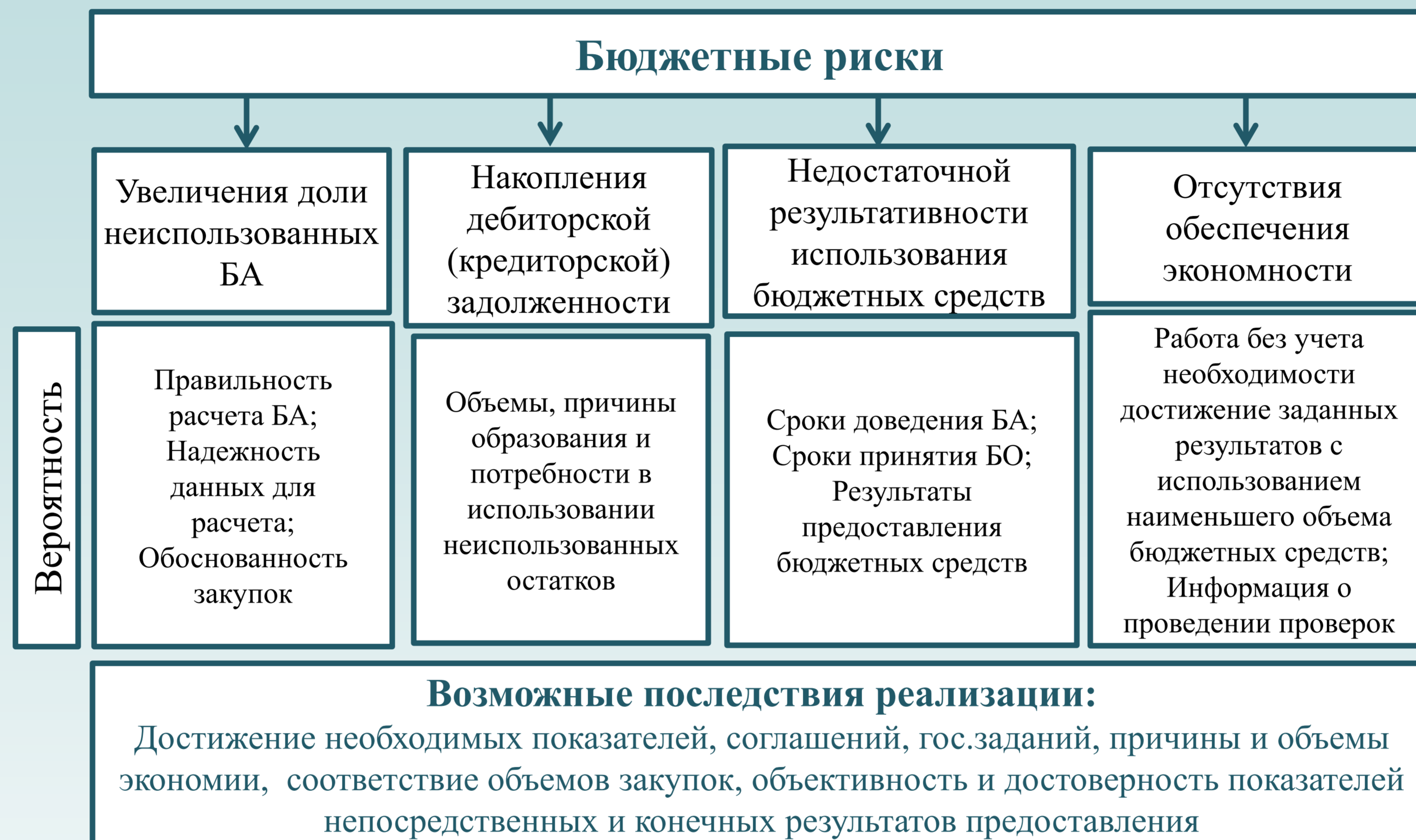
Рис. 1. Оценка результативности использования бюджетных средств