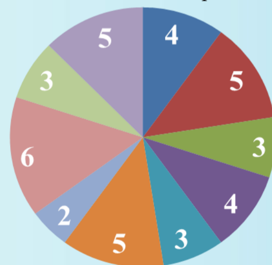
Рисунок 2 Результаты методики Ю.В. Микляевой «Выявление уровня сформированности коммуникативных умений и навыков детей».