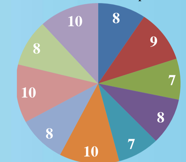
Рисунок 4 Результаты методики Ю.В. Микляевой «Выявление уровня сформированности коммуникативных умений и навыков детей».