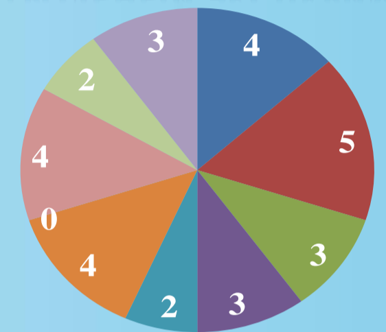
Рисунок 3 Результаты методики А. Остроуховой «Изучение степени адаптации ребёнка к ДОУ».