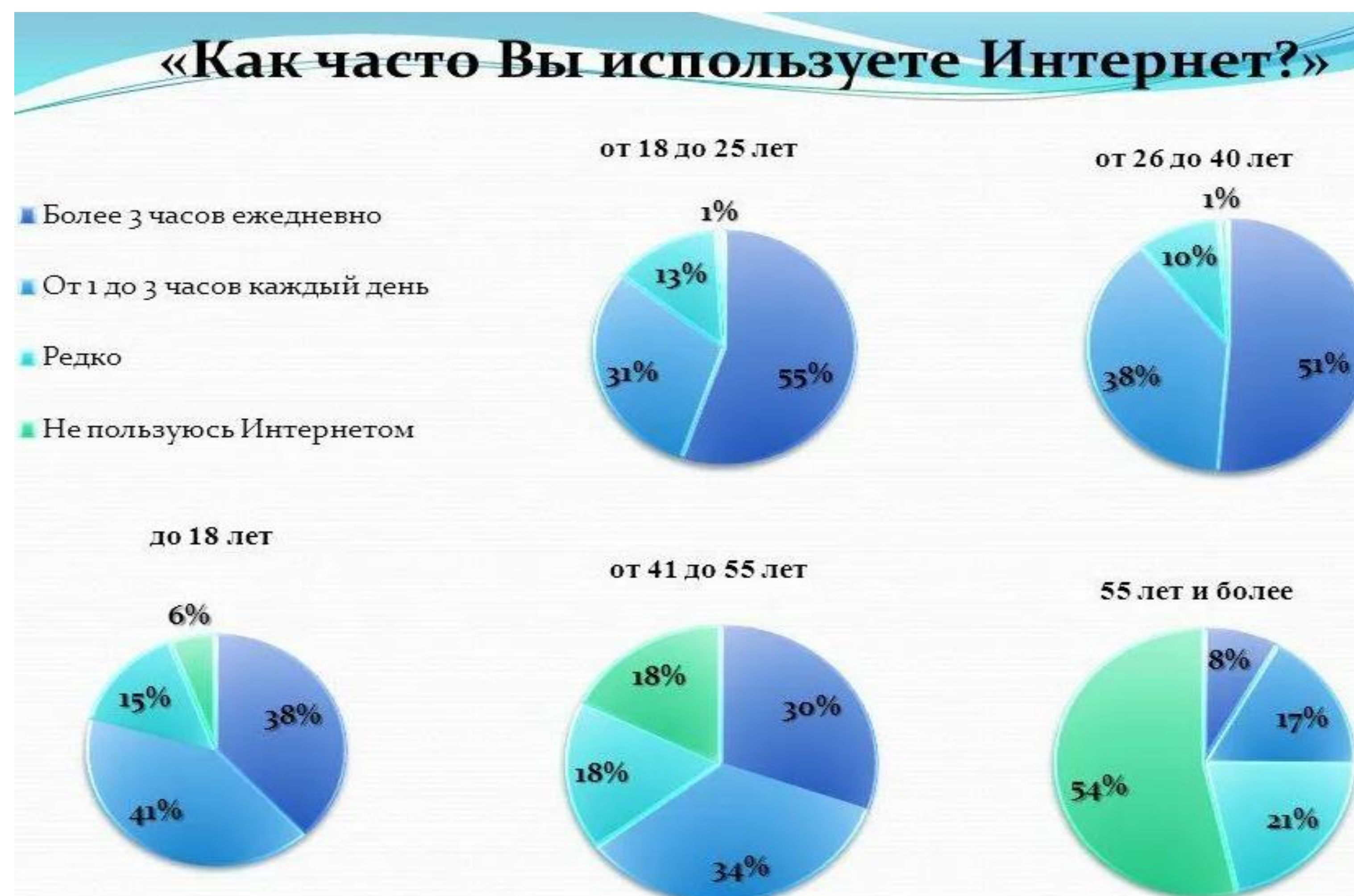
Рис.1 Диаграммы опроса «Как часто вы используете интернет?»

Разработка сайта — это целая индустрия в области программирования покорившая как и веб разработчиков так и обычных людей которые хотят сделать себе сайт сами для получения информации и оказания услуг