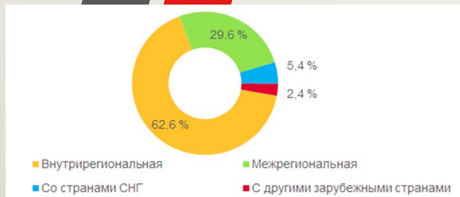
Рис.1. Структура миграционного оборота в Республике Бурятия (за 2020 г.)

Общее миграционное сальдо по Бурятии за 30 лет (с 1990 по 2019 гг.) составляет 65 434, что аналогично потере среднего городка. Особенно остро стоит вопрос с оттоком молодежи из Республики