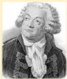
Антуан де Монкрентьен