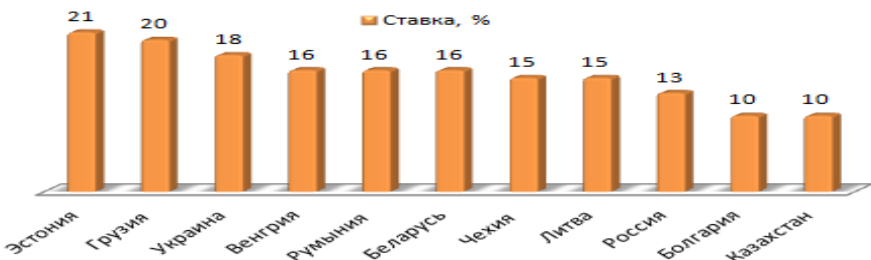
Страны с прогрессивной ставкой