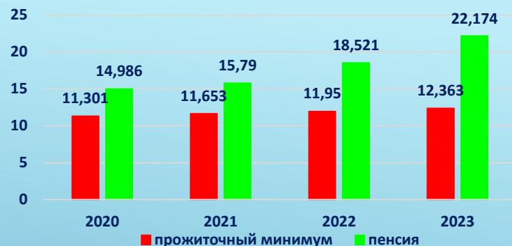
Соотношение прожиточного минимума к пенсии