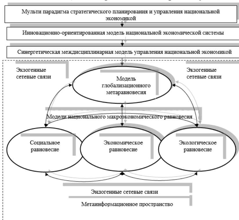
Рис. 1. Общий подход к формированию информационно-сетевой схемы управления экономикой в условиях глобализации