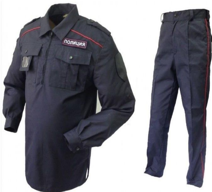
Костюм летний тактический темно-синего цвета