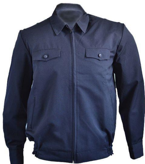
Куртка форменная, полушерстяная, темно-синего цвета