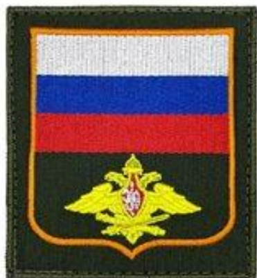
Тактический шеврон на липучке вышитый флаг и герб Российской Федерации