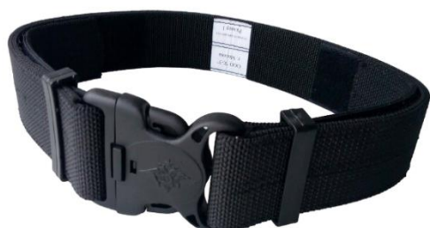
Ремень тактический МВД РФ