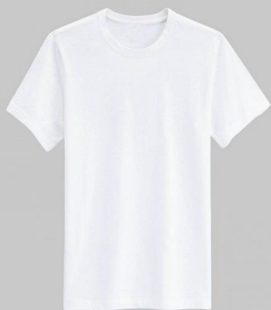
Футболка белого цвета, трикотажная