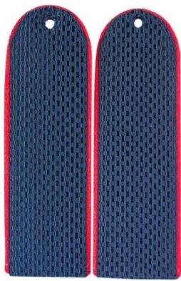
Погоны темно-синего цвета с красной окантовкой