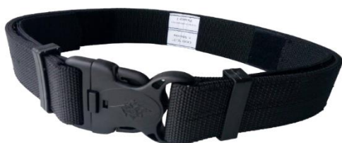
Ремень тактический МВД РФ