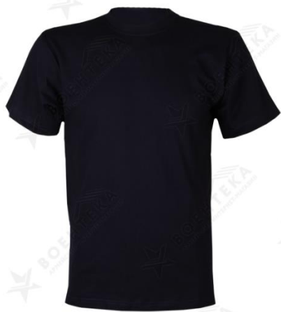
Футболка черного цвета, трикотажная