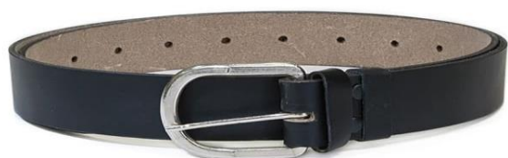
Ремень универсальный, кожаный, черный