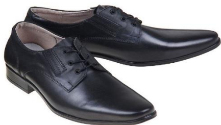
Туфли уставные МВД РФ